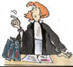
Anwalt Rechtsanwältin verkaufen