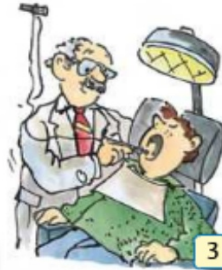
Z... weh tun