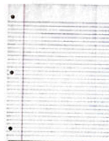
la hoja de papel